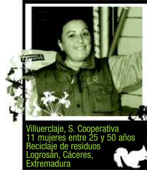
Villuerclaje, S. Cooperativa 11 mujeres entre 25 y 50 años Reciclaje de residuos Logrosán, Cáceres, Extremadura

En su opinión, la conciliación de la vida familiar y profesional es imprescindible para que estas realidades cambien, pero cree que en las zonas rurales estamos en un callejón sin salida “de hecho, las familias con más posibilidades de conciliar son aquellas en las que el hombre hace tareas agrícolas, porque tienen menos horario, pero por su mentalidad eso es un caso perdido y en la mayoría de las familias rurales en las que el hombre tiene otro tipo de ocupación, el horario suele ser de 10 horas al día. Y entonces, ¿qué tiempo va a repartir?”.